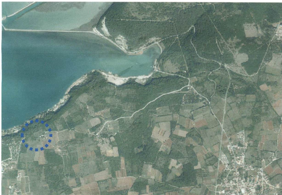
Područje obuhvata Plana prikazano na orto foto snimci (šira situacija)