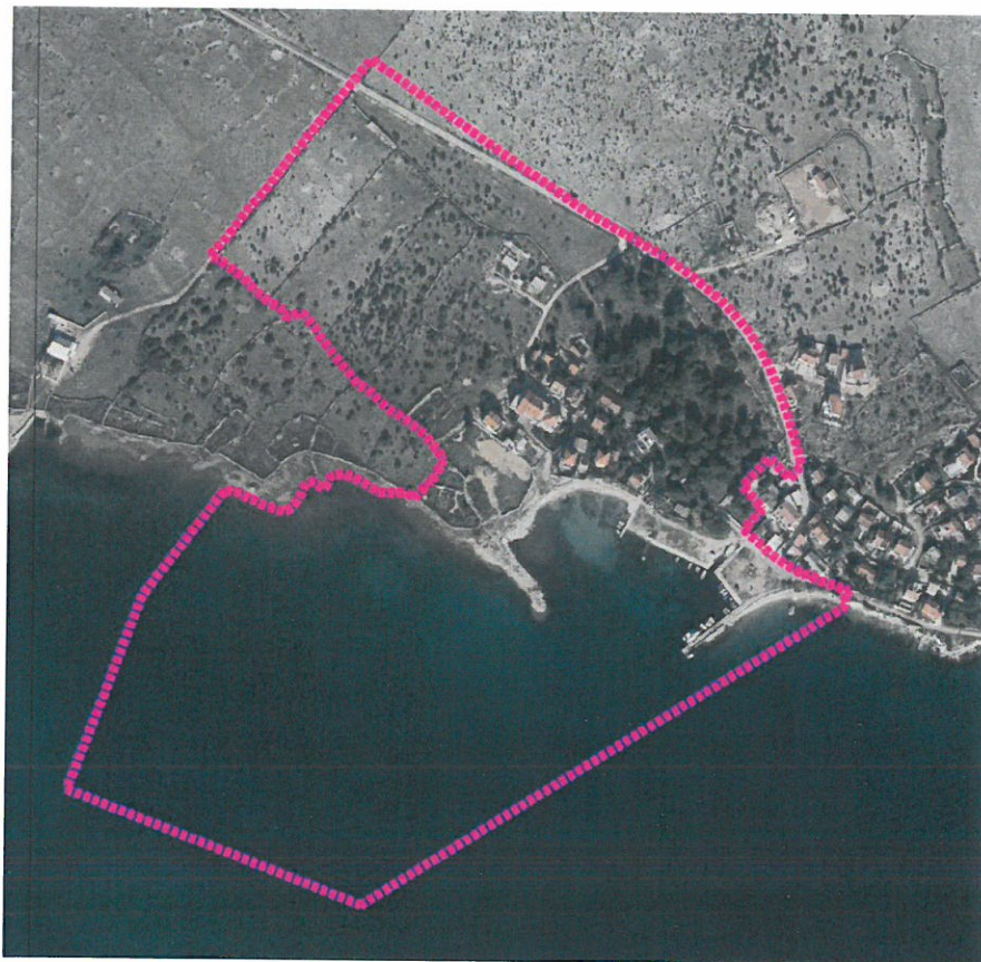
Obuhvat Plana prikazan na digitalnom ortofoto snimke