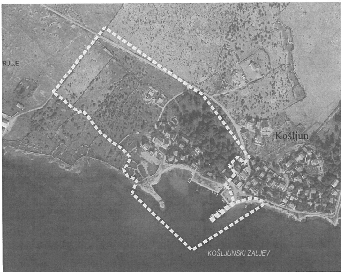
ObuhvatPlana prikazan na digitalnom ortofoto snimku