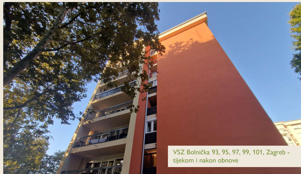
VSZ Bolnička 93, 95, 97, 99, 101, Zagreb - tijekom i nakon obnove