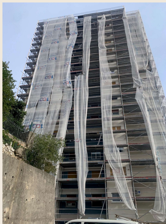
tijekom izvođenja radova