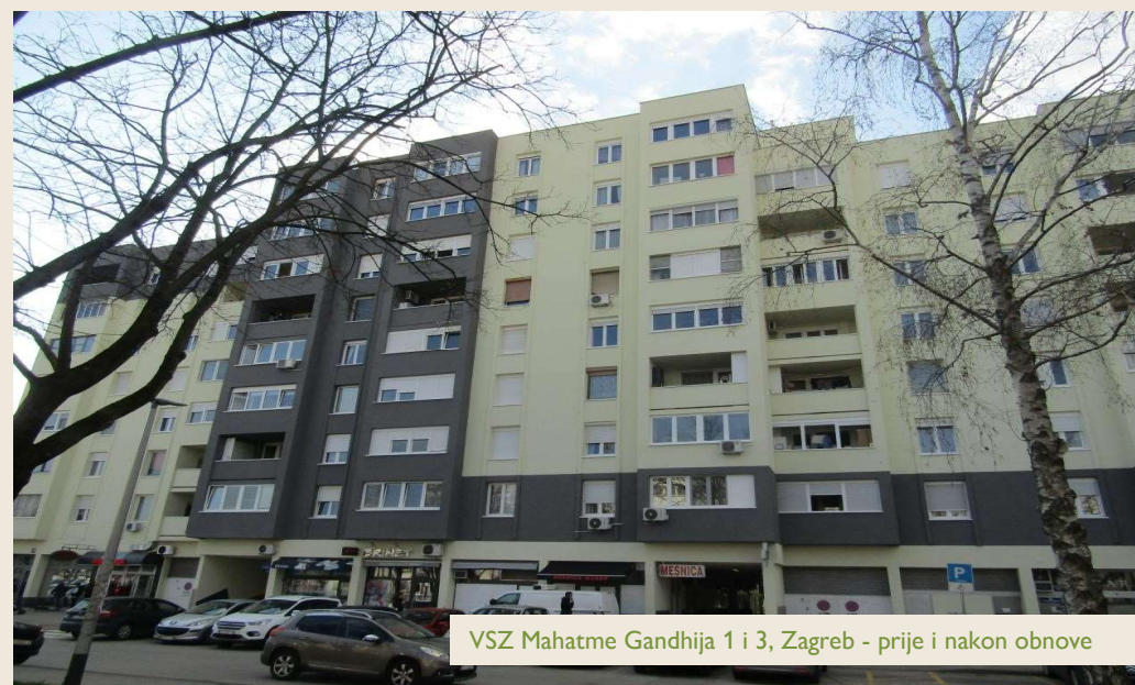
VSZ Mahatme Gandhija 1 i 3, Zagreb - prije i nakon obnove