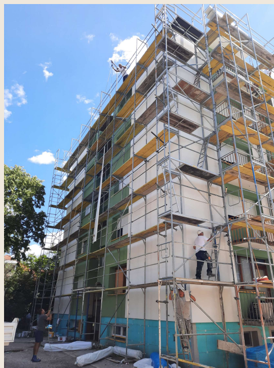
tijekom izvođenja radova