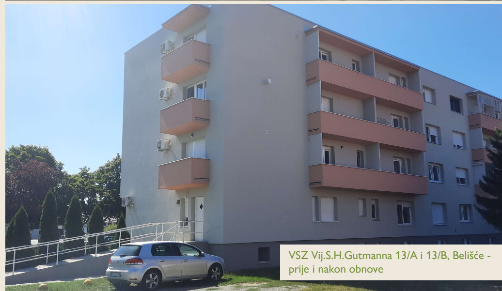
VSZ Vij.S.H.Gutmanna 13/A i 13/B, Belišće - prije i nakon obnove