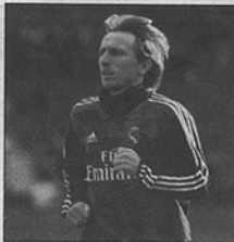
LUKA MODRIĆ u Realu je htio završiti karijeru

Modrić je jedan od najvažnijih članova prve postave Madridana te najstariji igrač sadašnje momčadi. Ostane li u klubu do kraja ugovora, ondje će vjerojatno završiti karijeru s napunjenih 36 godina.