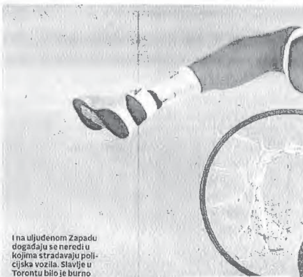
I na uljudenom Zapadu događaju se neredi u kojima stradavaju policijska vozila. Slavije u Torontu bilo je burno

Toronto Blue Jays (baseball) i Montreal Canadiens (hokej) posljednji su prvaci iz Kanade. Dogodilo se to 1993. godine