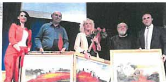
Dobitnici Povelja 30. april na svečanoj dodjeli