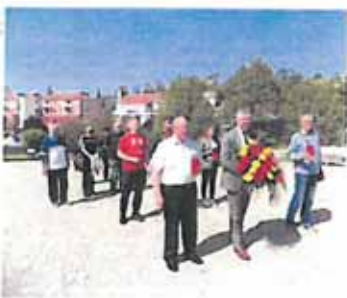
Polobotno cvrčice u Spomen parku