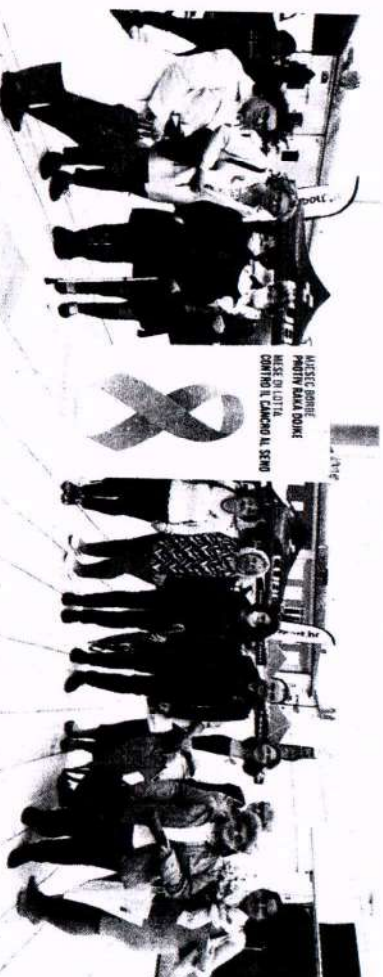
Akcija će se održavati na Trgu slobode

će obilježiti će se: postavljanjem velike ružičaste vrpce na Trgu slobode, kojim želimo senzibilizirati građane o važnosti prevencije i ranog otkrivanja raka dojke i to će tako biti cijeli mjesec te podjelom ružičastih vrpce za rever te druženje s građanima danas od 11 sati na Trgu slobode, a sudjelovaće sugradanke koje su preboljele rak dojke, kao i predstavnici zdravstvenih i drugih javnih ustanova u Poreču. Aktivnosti će se nastaviti hodanjem i vježbanjem za zdravlje i prevenciju raka dojke uz obilježavanje Nacionalnog dana borbe protiv raka dojke, a uključiti se mogu svi zainteresirani i to danas u 17 sati ispred zgrade Općinskog suda te organizacijom javnozdravstvenih predavanja za mlade u suradnji s Zavodom za javno zdravstvo Istarske županije kako bi se osvijestila važnost samopregleda i prevencije. (G1)