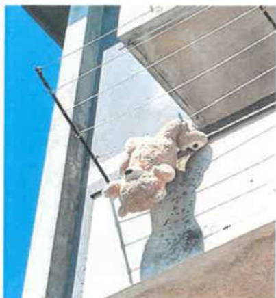
U Zoranićevoj na Verudi