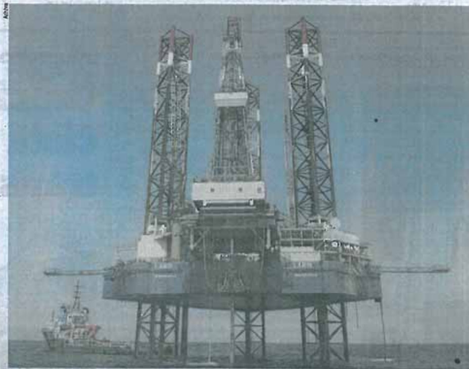
Platforma "Labin" 30 milja od Pule - plin se ovdje crpi od 1999., a snimak je iz 2013. godine