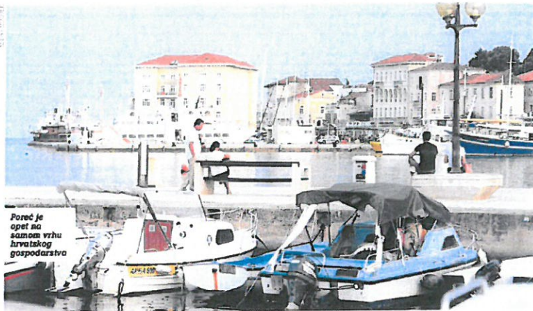
Poreč je opet na samom vrhu hrvatskog gospodarstva

Dobrim rezultatima poduzetnika sa sjedištem u Zagrebu najviše je doprinijela INA d.d., u Splitu Tommy d.o.o., u Rijeci Plodine d.d., u