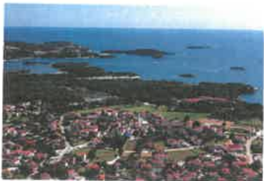
Funtana iz zraka

Objavljeno: 4. studenoga 2021. u kategoriji – Novosti