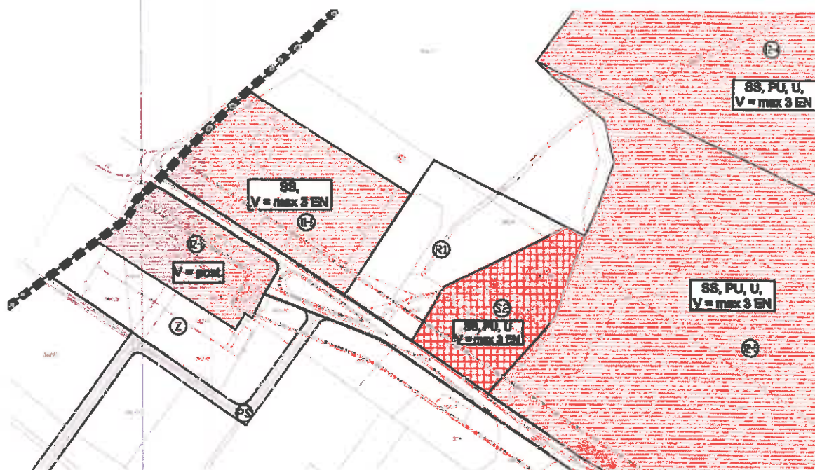
prilog 4. UPU Barbariga zapad I i II, kartografski prikaz 4b. način i uvjeti gradnje