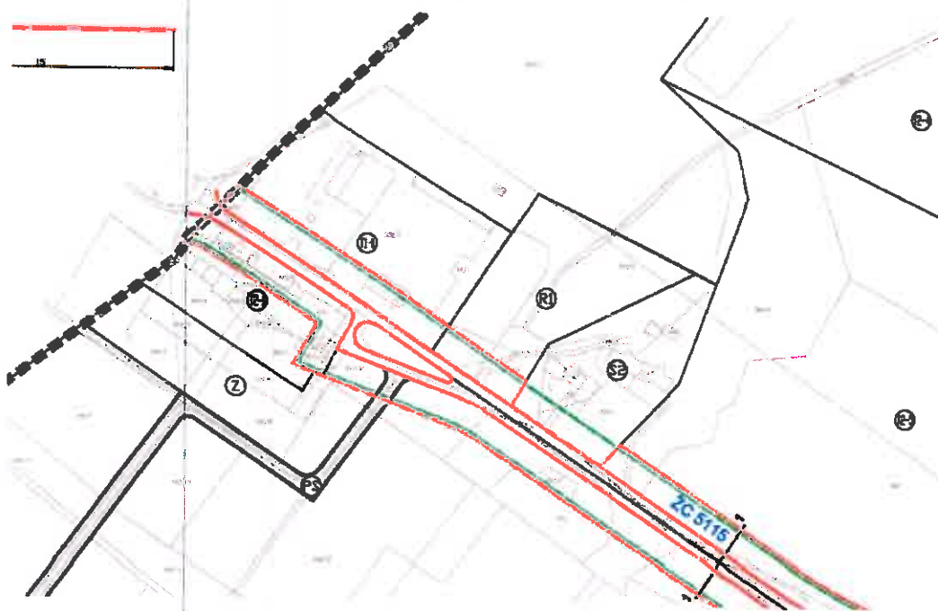
prilog 2. UPU Barbariga zapad I i II, kartografski prikaz 2. promet