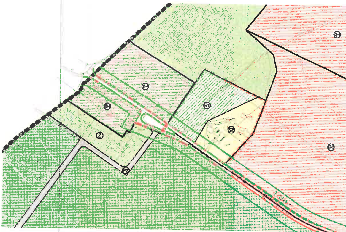
prilog 1. UPU Barbariga zapad I i II, kartografski prikaz 1. namjena površina