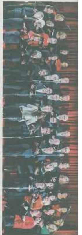
KUD "Matko Brajša Rasana" čuva uspomenu na velikog istarskog zborovoda, skladatelja i melografa