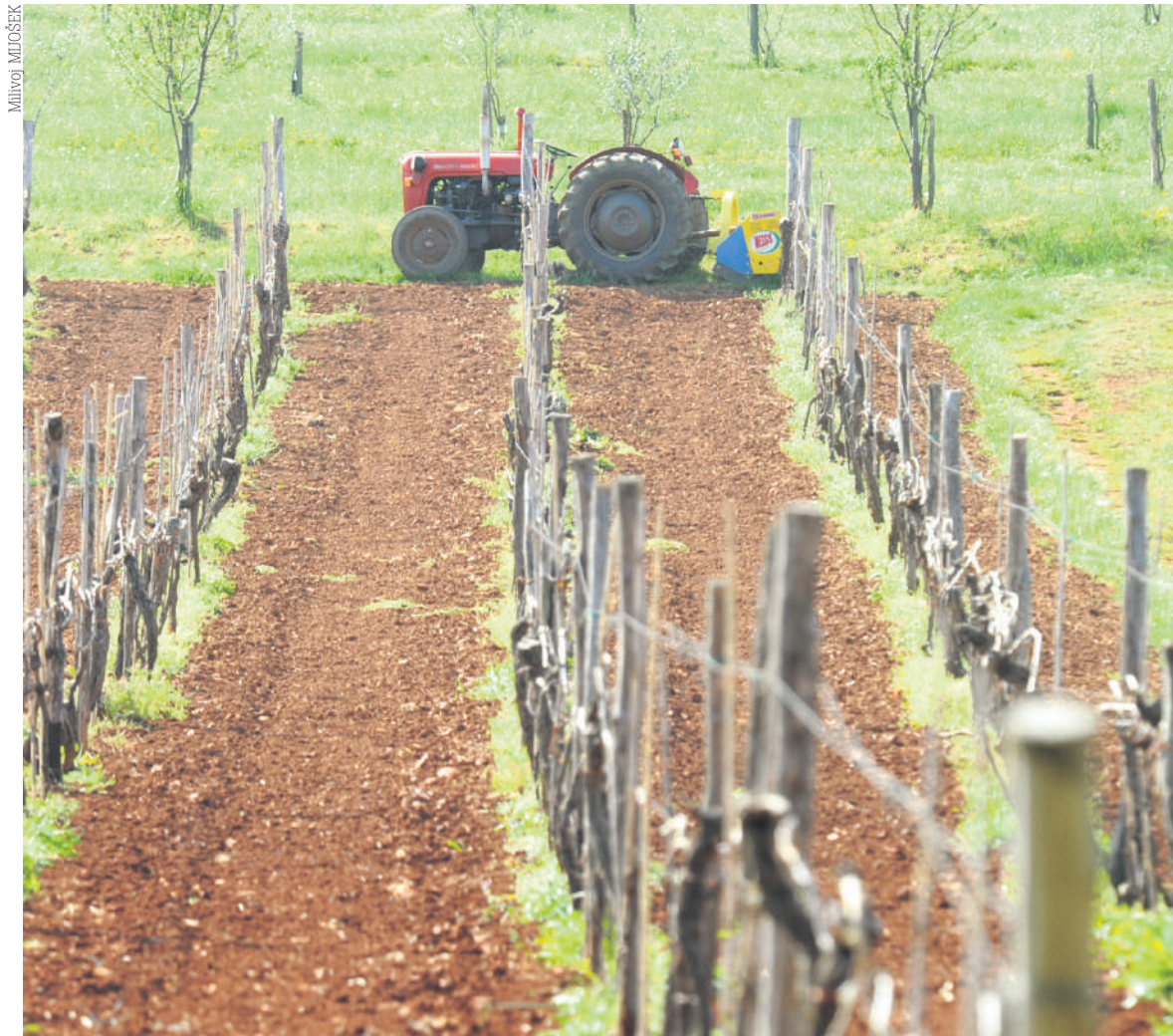
Prvi Sajam poljoprivrede u Istri

Sajam će se održati upravo u toj dvorani koja se prostire na 1.200 četvornih metara, ali i na prostore izvan dvorane površine 3.700 četvornih metara, a u sklopu ovog sajma održati će se i tradicionalna manifestacija 16. Dani meda. Na sajmu, točnije na igralištu osnovne škole, posjetitelji će moći iskušati probnu vožnju traktorom John Deere. U suradnji s muzejom Tractor story iz Baredina (porečka Nova Vas) na sajmu će se prezentirati najstariji traktor u Hrvatskoj koji ove godine "slavi" sto godina, ali i najstariji kombajn u ovom dijelu Europe.