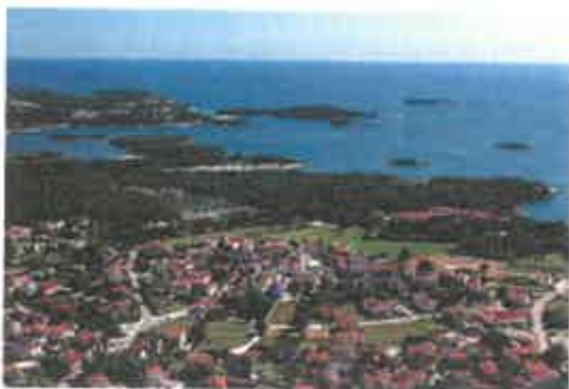
Funtana iz zraka

Objavljeno: 15. prosinca 2021. u kategoriji – Novosti