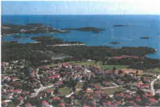
Funtana iz zraka

Objavljeno: 15. prosinca 2021. u kategoriji -- Novosti