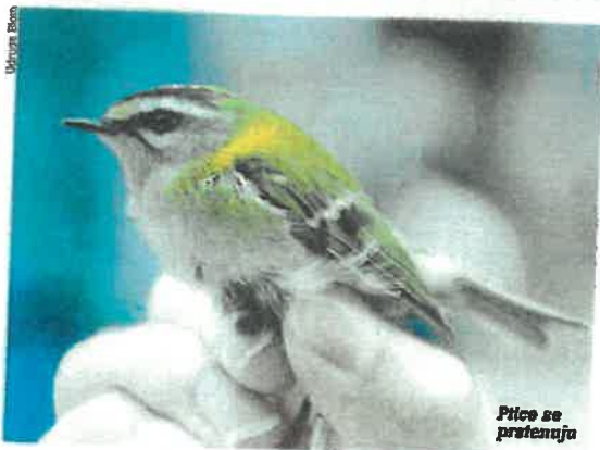
Ptice se prstenuju

vila u radu s pticama. Kamp će za uzvrat pružiti opuštajući boravak u prirodi, okruženje prepuno entuzijastičnih domaćih i međunarodnih volontera, nova znanja o pticama i njihovim staništima te ostalim biološkim i životinjskim vrstama Učke.