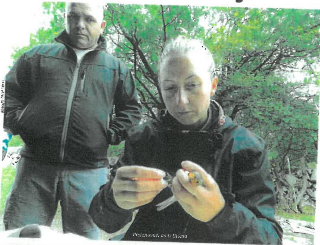
Prstenovači su iz Bioma

Za sudjelovanje u kampu, napominju organizatori, nije potrebno prethodno znanje i iskustvo, već dobra volja, spremnost na rad, sudjelovanje i učenje te poštivanje pra-