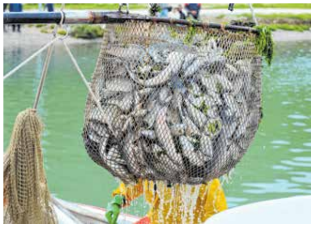
Pričat će se na sajmu i o kvotama za izlov ribe u Jadranu

U dvorani će više od 80 izlagača iz Hrvatske, Italije, Slovenije i Španjolske predstaviti proizvode iz ribarstva i akvakulture, ribarske opreme i alata, plovila te sve za opremanje i zaštitu plovila, zaštitne odjeće, opreme za profesionalni i sportski ribolov i sportove na vodi. Prezentirat će se i kompletna oprema za uzgoj školjkaša i ribe. Predstaviti će se i proizvođači konopa, vrsa, preradiivači ribe i ostalih morskih plodova, a bit će predstavljene inovacije za čišćenje vodenih ekosustava. Ove godine sudjeluje i rekordan broj odgojno-obrazovnih i istraživačkih institucija. Bit će tu, kako je najavljeno, i specijaliziranih vozila za prijevoz - hladnjača, brodskih i izvanbrodskih motora, elektro motora, rezervnih dijelova, propelera, ledomata, šokera, grijalica, radiokomunikacijska oprema i pribor, brodska elektronika