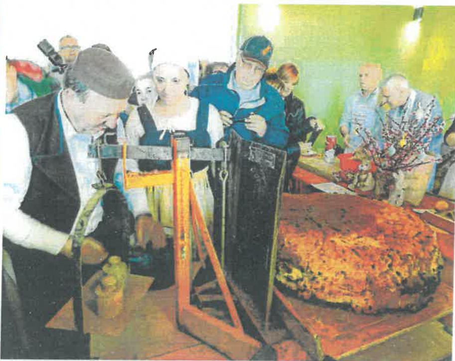
Vaga je pokazala da je pinca dva kilograma lakša od lanjske