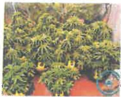
Zaplijenjeno je deset uzgojenih stablika indijske konoplje

Pronađeno je i devet staklenki s marihuanom ukupne bruto težine 10.126 grama, 15,9 grama halucinogenih gljiva, 2,7 grama hašiša i dvije tablete ecstasyja. (M. Vu.)