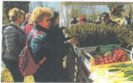
Šparuge, jaja, rotkvice...

Domaćice su pokazale kako se nekad mijesila i pekla pinca, izložile su pince, uskrane kolače, piturana jaja, održan je turnir u pičenju jaja, otvorena mala buteiga vazmene hrane, pince, jaja, špalete, mlađog luka... i sve to uz domaću besedu i kanat. U oči uskrnog razdoblja, ujedno početka turističke predsezona na Poluotoku, Žminj je među prvima otvorio svoja vrata posjetiteljima pozivom