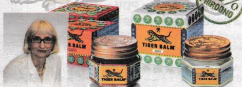
DIJANA HEDER, dr.med.

TIGROVA MAST sadrži 100% prirodna, eterična ulja. Laganim utrljavanjem kod bolova poboljšava cirkulaciju i djeluje protuupalno. Povećava prokrvljenost i temperaturu kože, daje ugodan osjećaj topline, nakon čega slijedi osvježavajuća hladnoća.