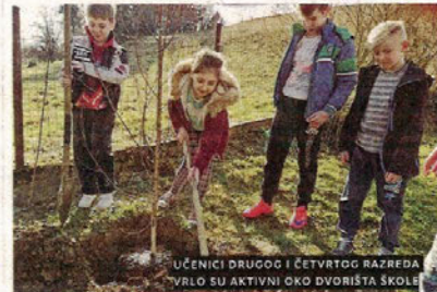
UČENICI DRUGOG I ČETVRTOG RAZREDA TVRLO SU AKTIVNI OKO DVORIŠTA ŠKOLE