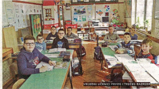
VRIJEDNI UČENICI PRVOG I TREĆEG RAZREDA