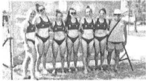
igranje u Klubu Plesni Siskovci

Utrčali su u ljetnu vrućinu, ali i u vrućinu plesne scene. Utrčali su u ljetnu vrućinu, ali i u vrućinu plesne scene. Utrčali su u ljetnu vrućinu, ali i u vrućinu plesne scene.