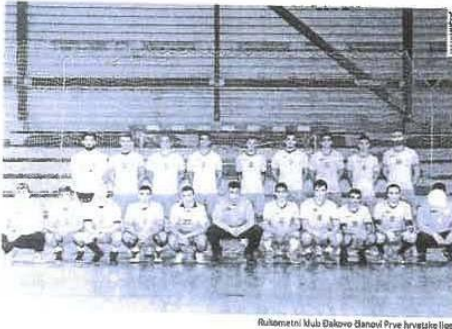
Rukometni klub Đakovina članovi Prve hrvatske lige