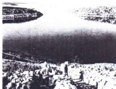
Na jesen stiže i program »Pomalo i po kraju!«

Jedinstveni upravni odjel Općine Mrkopalj