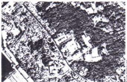
Zona izvođenja radova u Kraljevici

KRALJEVICA » U Strossmayerovoj ulici u Kraljevici danas počinje sanacija kolnika, kao i oborinske odvodnje te nogostupa, a bit će postavljena i nova prometna signalizacija. Radovi će potrajati do 1. listopada, javljaju iz Grada Kraljevice. Radovi se izvode u Strossmayerovoj ulici od kućnog broja 1 do kućnog broja 38, odnosno od raskrižja Strossmayerove ulice i Zrinskog trga u centru do otprilike 110 metara iznad ulaza u dječji vrtić Orepići. Ukupna duljina dionice na kojoj se izvode radovi je 450 metara.