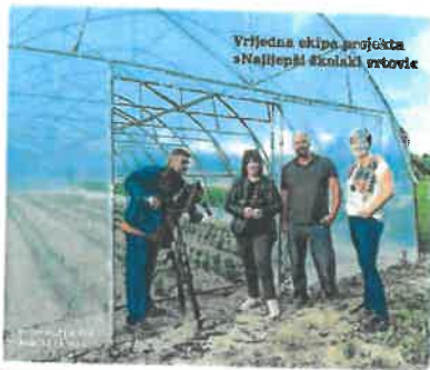
Vrijedna ekipa projekta »Najbolji školski otvori«