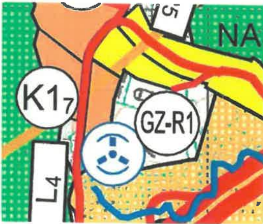
Slika 2: Helidrom

Ako je građevina, crta se na Karti 1, ako nije građevina, već jedan od režima korištenja na GZ-R1 onda se ne crta na Karti 1.