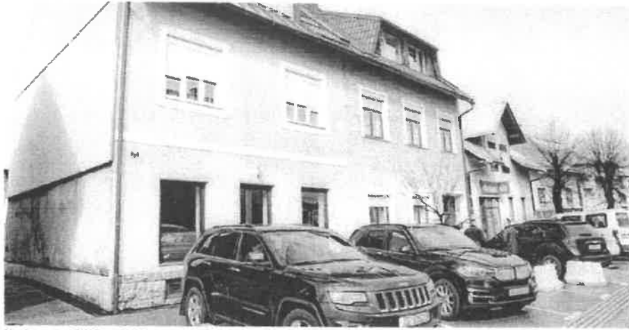
Novi prostor PINS-a u Delnicama smješten je na adresi Supilova 71