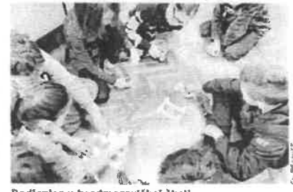
Radionica u brodmoravičkoj školi

najpotrebnije brojeve koje treba znati odmah ako se dogodi bilo kakva nesreća, požar ili neka slučajna nevolja. Uz usvajanje tih brojeva učenici su kroz likovni i pismeni izraz obradili djelatnosti hitnih službi (policija, hitna, vatrogasci, GSS...), a posebno dio poduke bio je vezan uz to uskopi se mašini pri do javi treba obavijestiti i što govoriti kako bi što bolje bilo što spremnije za dolazak i pomoć. Radionica je provela volonterka GDRK Društva »Tajana« kćerka Manca (M. K.)