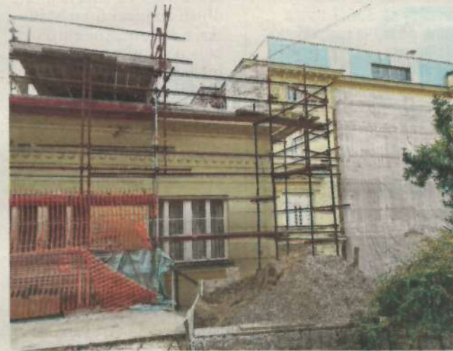
Značajan dio hotela Kvarner opasan je skelama

Od srpnja do rujna, dakle, u glavnoj sezoni je tvrtka pak