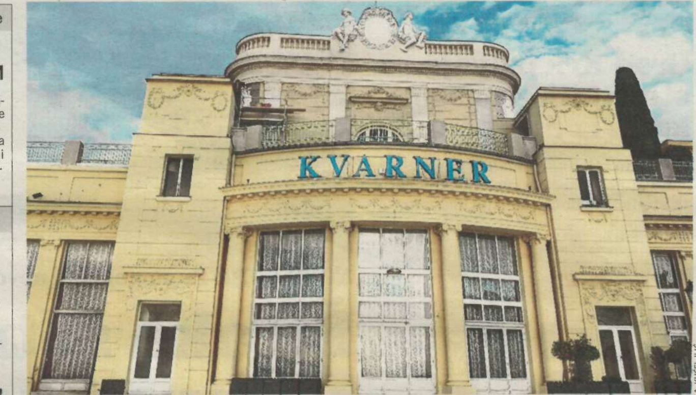
Ornamenti na fasadi najstarijeg hotela na Jadranu obnovljeni su, a radovi traju i dalje