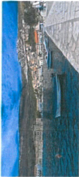
Za više informacija posjetite stranicu...