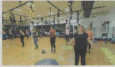
Potpuno su zaključane rekreacijski centri i teretane