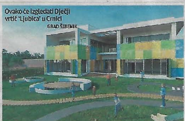
Ovako će izgledati Dječji vrtić 'Ljubica' u Crnici

tu. Zatoni smo od Euroskog po- lioprivrednog fonda za ruralni razvoj osvojili 717 tisuća kuna. Uz priloženih donacija line za novo dječje igralište u Crnici uz sport i oca: "Ljubica" i neton izgrađeno igralište za djecu s posebnim potrebama u Park Šumi Šubićevac, a za koje nam je Jadranska banka doni- rala 750 tisuća kuna, ne treba zaboraviti ni dječja igrališta na Krapnju, Žirni i Meterizama, za koja smo također osvojili sifi- nanciranje iz lokalnih donaci- je. Pripremili smo dokumenta- cijuz energijsko i tehnološki pre- stalih vrtićkih objekata i škola, čiji je osnivač Grad Šibenik. Uopće ne sumnjam da ćemo određena sredstva povući, jer dosadašnje iskustvo nam na to ukazuje - rekao nam je Mileta. Da podsjetimo, prije nekoliko godina, sukladno zakonskim odredbama o predškolskom odgoju i obrazovanju, Grad Šibenik je tada jedinstvenu pred- školsku ustanovu Gradske vrtić Šibenik "razdvojio" u dvije: DV "Šibenska maslina" i DV "Smilje". Sobzirom na to da Dječji vrtić "Smilje" nema proračunsku liniju, koriste usluge "Šibenske masline". ●