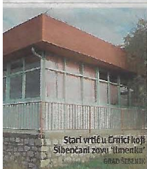
Stari vrtić u Crnici koji Šibenčani zovu 'Mileta'