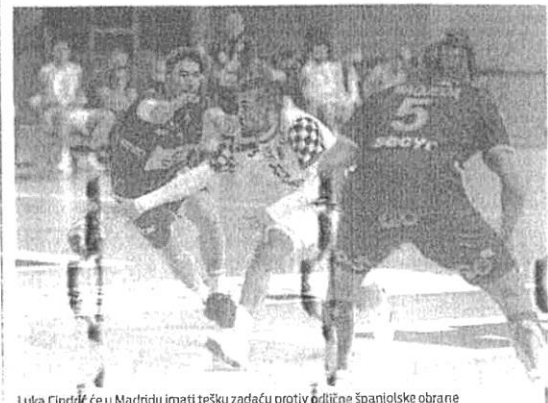
Luka Cindrić će u Madridu imati tešku zadaću protiv odlične španjolske obrane