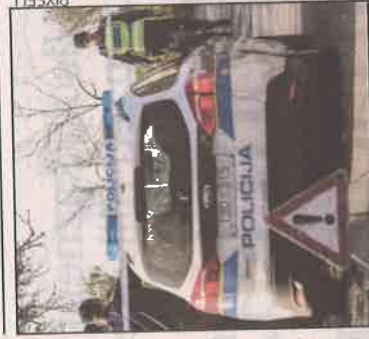
Još su četiri osobe ozlijeđene u nesreći, ali nisu životno ugrožene

Dvogodišnji dječak iz Antina, sela ne daleko od Vinkovaca, smrtno je stradao u prometnoj nesreći koja se jučer, oko 10.20 sati, dogodila na cesti Ostrovo – Tordinci. U nesreći su ozlijeđene četiri osobe kojima je pružena medicinska pomoć u vinkovačkoj bolnici i svi oni, kako se doznaje, nisu životno ugroženi. Prema navodima policije, do nesreće je došlo kada je vozačica osobnog vozila (52) zbog neprilagođene brzine u zavoju izgubila nadzor nad vozilom te prešla na suprotni kolnički trak gdje je došlo udara u osobno