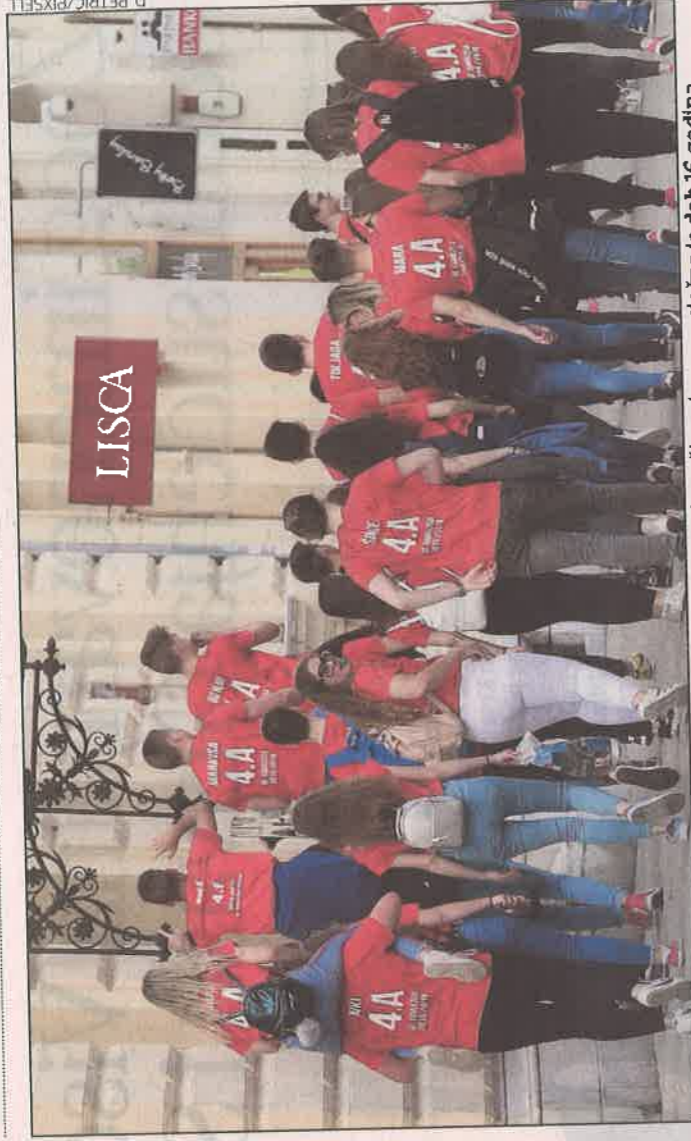
UKUPNO 1703 Osječana od 14 do 19 godina sudjelovalo je u istraživanju, a prosječna je dob 16 godina