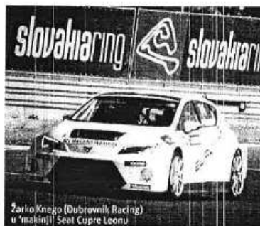
Žarko Knego (Dubrovnik Racing) u 'mekinji' Seat Cupre Leonu

Više od tridesetak hrvatskih vozača vozilo je proteklog vikenda na Slovačka Ringu, stazi čiji je krug 5923 metra dug sa 14 zavoja, i koji je izgrađen prije 11 godina. Sjajno zdanje, 40 kilometara od Bratislave, ugostilo je u su-