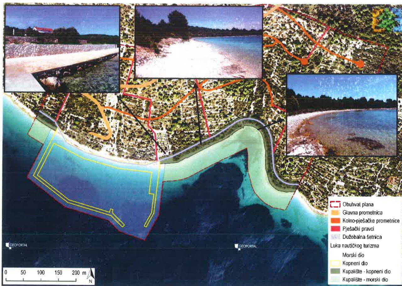
Slika 1.1 Izmijenjeni dijelovi prirodne obale

Napomena: Nije bilo sudionika u javnoj raspravi čija mišljenja, prijedlozi ili primjedbe nisu razmatrani.