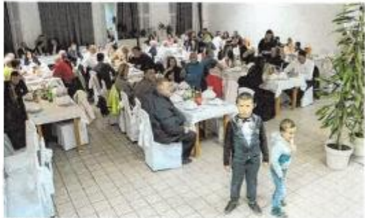
Tradicionalno druženje zadrinskih Bošnjaka i njihovih prijatelja