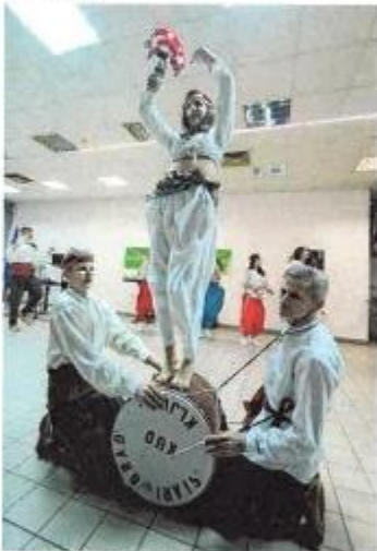
KUD "Stari Grad" iz Ključa