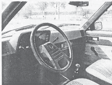
Unutrašnjost je bila za to doba veoma dobro opremljena

U SAD-u će pak Horizon/Omni ostati u ponudi sve do 1990. i steći kulturni status kao prvi američki kompakt s prednjim pogonom. Posebno su cijenjene ojačane verzije, u kojima je svoje prste imao i sam Carroll Shelby, poznate pod kraticom GLH ('Goes like Hell'). Zanimljivo je su alati i preše po prestanku proizvodnje prodani u Indiju korporaciji Tata, koja je potom nekoliko godina proizvodila svoju inačicu Horizona (Autoportal)