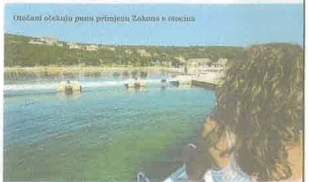
Otočani očekuju punu primjenu Zakona o otocima

Dalje se navodi kako vijećnici o načinu primjera i aktivnosti