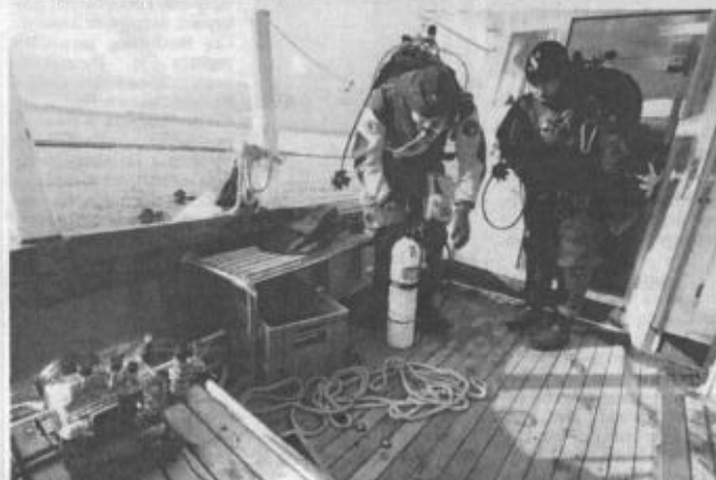
Provjera se oprema

to su sasvim solidni uvjeti za zaron. Tijekom plovidbe do odredišta osjetilo se nestrpljenje. Pomno su pripremali opremu – nepropusna ronilačka odijela, topla pododijela, čarape, maske, bocice... – To je tako. Kad zaronite prvi put, ili vas to uzme i ronite cijeli život, ili ne, kratko pojašnjava Igljić. Svi ostali potvrdno kimaju glavom te dodaju svatko ponešto, no uglavnom se to svodi na ljubav prema svemu što more pruža, a samo ronjenje doživljavaju kao samo svoj trenutak s podmorjem. Tamo dolje su, kažu, sami, u tišini i svom svijetu. Odušak je to od svakodnevice, stresa, problema, ali i velika strast koja nosi i ponešto adrenalina. On je najizraženiji nakon izrona, kada dijele iskustva i prepričavaju što su dolje u dubinama vidjeli. Pitamo ih za opasnost, primjerice raže i murine, morske pse i slično. S osmijehom odgovaraju kako je najveća opasnost sam čovjek, a za ronioce onaj za kormilom broda ili gliseraša. – Vidao