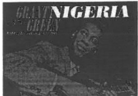
Stranu listu predvodi Grant Green i Nigeria

Na vrh top ljestvice stranih izdanja dospjelo je izdanje pod nazivom Nigeria, Granta Greena. Na broju dva je Hank Mobley i njegov album Poppin', a na trećem se mjestu našao Stanley Turrentine uz album Comin' Your Way