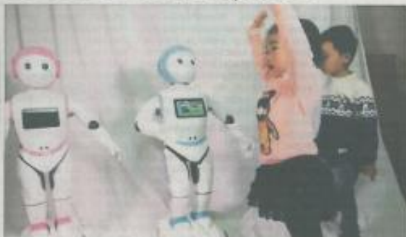
Cijena ovog robota je oko 1.200 eura

ŠANGAJ »Robot veličine djeteta koji govori kineski i engleski, poučava matematičku, priča šale i predlaže igre predstavljen je nedavno u Šangaju a zamišljen je kao pravi najmanji dječji kupača se nemaju s kim igrati. »Ipak, visok poput petogodišnjaka, pokreće se na kotačima, ima gubitne ruke, na prsima mu je velik zaslon-tablet a pokrećive oči su opremljene tehnološkim za prepoznavanje lica. »Robot je zamišljen kao