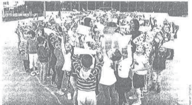
Učelnici su s oduševljenjem prihvatili sudjelovanje u mišljenjskoj fotografiji u povodu današnjeg Dana kravate

Svake godine na različite načine obilježavamo Dan kravate kada podsjećamo učenike na simboliku kravate te njenu povijest, rekla je Elza Nadarević, jedna od organizatorica