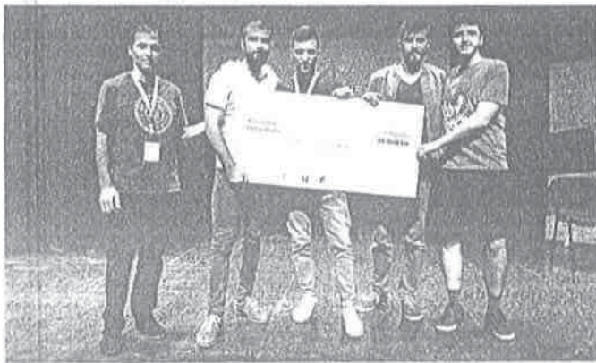
Članovi pobjedničkog tima El Negocio

Pobjednička aplikacija ima puno potencijala koje bi grad mogao implementirati, ali to moramo uraditi u suradnji s Liburnijom. Ipak, vrlo je zanimljivo bilo vidjeti načine na koji mladi promišljaju o određenim problemima u gradu te o njihovom rješavanju, zaključio je Erlić.