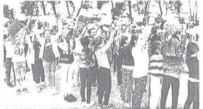
Djeca su pozerala držedi šarene papiriće kako bi kravata bila veselija

Temeljem članka 96. stavak 3. Zakona o prostornom uređenju ("Narodne novine", broj 153/13 i 85/17) i Zaključka Gradonačelnika Grada Zadra, KLASA: 350-01/17-01/12, URBROJ: 2198/01-2-18-12 Upravni odjel za prostorno uređenje i graditeljstvo Grada Zadra, o b j a v i j u e