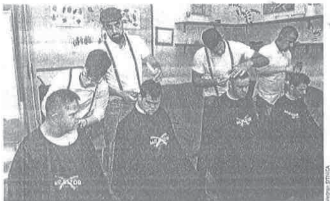
Učelnici dolazili jedan za drugim u improvizirani frizerski salon