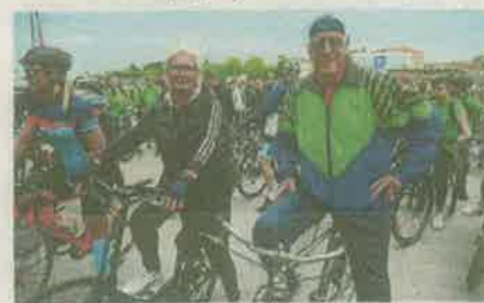
Sudionici svih uzrasta prikupili se biciklijadi

Sudionici bicikljade smatraju da se pitanje biciklističkih staza u Zadarskoj županiji