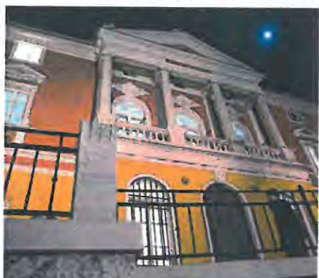
Muzej antičkog stakla u Zadru već godinama priređuje razne izložbe

Virtualna izložba »10 Božića u MAS-u« prikazuje 10