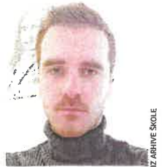
IZ ARRIVE SKOLE

- Mi tu imamo i sandučić povjerenja, da nam se anonimno obrate u slučaju da doživljavaju bilo kakav oblik nasilja, ili da nam se jednostavno poverje oko bilo čega što ih muči. Ranijih godina su učenici više koristili taj sandučić, dok ove godine, nisam nam se povjerili, iako su se raspiivali