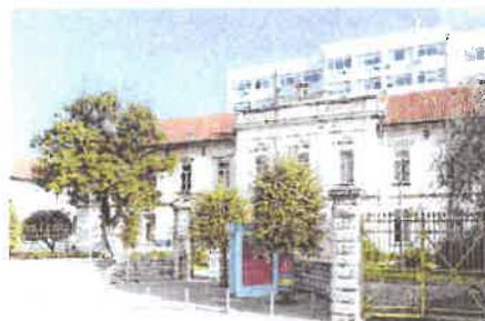
U OB Zadar skraćena je lista čekanja za magnetsku rezonanciju

Medicinsko zračenje jest vrlo važan dio moderne medicine, no nužno ga je koristiti onda kada je indikacija opravdana, onda kada je zračenje