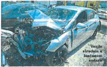
Vozila stradala u lančanom sudaru

ZADAR » U Policijskoj upravi zadarskoj saznajemo kako su jutros u 7.50 dobili dojavu o prometnoj nezgodi na državnoj cesti D424, kod čvora Sveti Martin, a u Zamjenica glasnogovornice, Sonja Šimurina, kazala nama je kako je policijski očevid u tijeku te će se o okolnostima