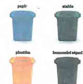
Raspored lokacija zelenih otoka na području Obrova