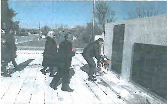
Rođitelji i obitelji poginulih branitelja položili su vijence u znak sjećanja