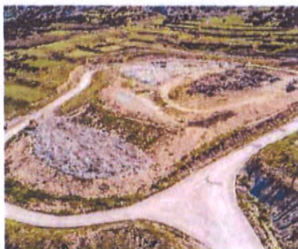
Odlagalište Sv. Kuzam

godine administrativno pripadale Pagu, vijećnici su donijeli zaključak kojim se ovlašćuje