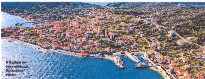
U Kalima se čeka sjednica Općinskog vijeća