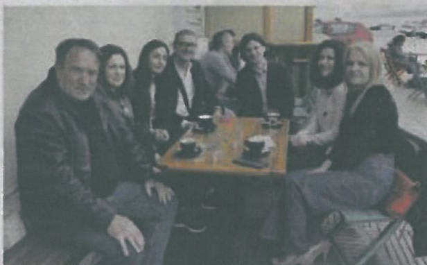
Poseta u kulturnom Muzeju