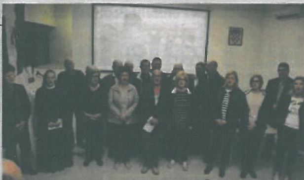
Horšte i Zbor crkvice Sv. Marije Sali