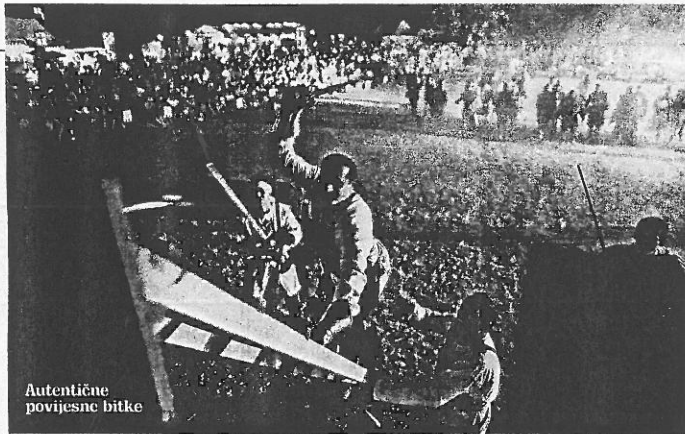
Autentične povijesne bitke