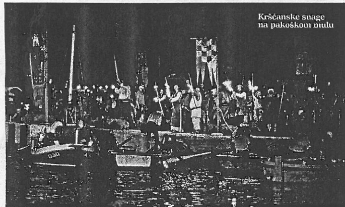
Kršćanske snage na pakoškom mulu