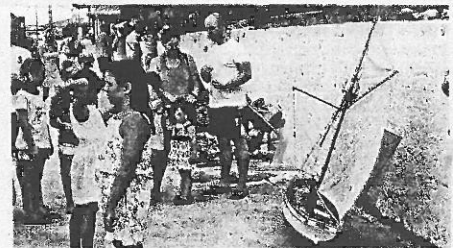
Plovidba maketa privukla je velik interes