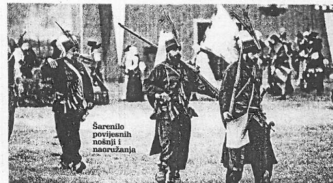
Šarenilo povijesnih nošnji i naoružanja

-Još od 9. stoljeća na ovim su se prostorima gajile kršćanske vrijednosti i čuvao hrvatski identitet. Vitezovi vranski proizašli su iz spomena na vitezove Templare iz 12. stoljeća te Ivanovce iz 13. i 14. stoljeća, zaključila je Danijela Vuilin.