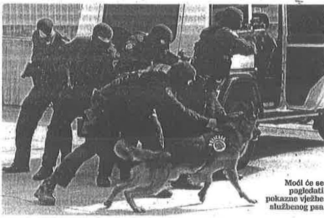
Moći će se pogledati pokazne vježbe službenog psa