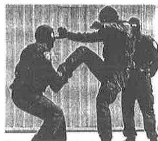
Prezentirat će se i borilačke vještine