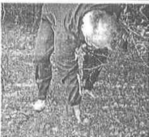
Berači gljiva moći će bezbrižno u šumu