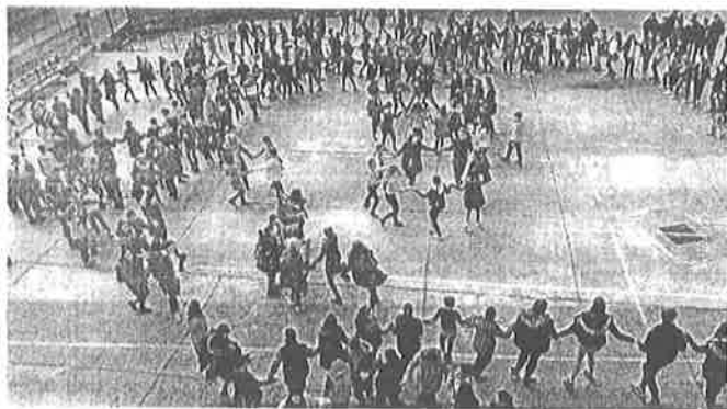
Posjet je podrazumijovao i upoznavanje rumunjske (pobosno) tradicije

Rumunjskoj održali vrlo uspješnu prezentaciju naše škole, grada Zadra i Hrvatske, ali i upoznali tamošnju sredinu, prvenstveno rumunjski grad Simleu Silvaniei i njegove povijesne i kulturne znamenitosti. Obišli smo njihovu turističku zajednicu i muzej holokausta iz staroj sinagogi, a osim upoznavanja s gradom domaćinom učenicima su sudjelovali i u kreativnim radionicama, među kojima su bile i baštinske radionice na kojima su se svi sudionici upoznali s rumunjskom kulturnom baštinom i doznali više o poznatim Rumunjima iz svijeta znanosti, umjetnosti i sporta. Učenicima su se također upoznali i s rumunjskom tradicionalnom gastronomijom koja ima sličnosti s hrvatskom kontinentalnom kuhinjom, doznajemo dalje od prof. Danijele Riger-Knez, koja još pojašnjava kako nakon svakog zajedničkog susreta učenika i nastavnika, slijedi i susret nastavnika na kojem se rezimira realizirano u projektu i dogovaraju daljnje aktivnosti pomoću kojih će se ostvariti projektni ciljevi.