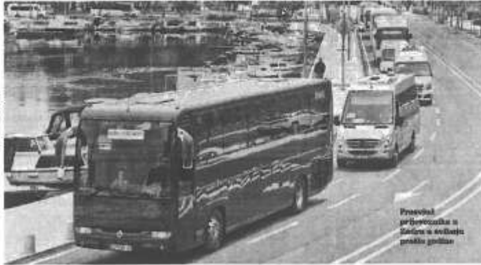
Prosvjed prijevoznika u Zadaru u svibnju prošle godine

nije zabranjen, ali da nemoju koga voziti.