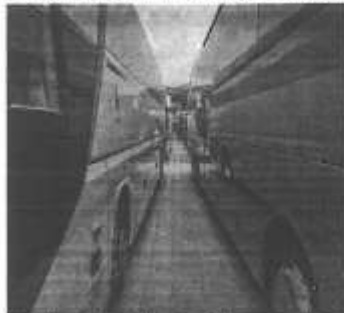
Autoprijevoznici se našli u slijepoj ulici

Kako kaže Jure Meštrović, zadarski predstavnik inicijative Povremeni prijevoz putnika «Hronk for hope» (Potrubu za nadu), ne da su opet na početku, nego su sad već - na dnu.